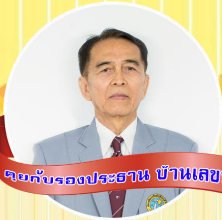
คุณกำรองประธำน บ้ำนเลขที่ ๑